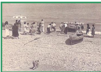
La antigua playa

La historia de la playa de Almassora viene marcada por un triste protagonista: el Puerto de Castellón. La creación del puerto y su perjuicio fue tal que muchas propiedades de vecinos fueron literalmente tragadas por el avance del mar. Nunca hubo indemnización. Incluso los vecinos –¡vaya paradoja!- tuvieron que sufragar de su bolsillo pequeñas obras para protegerse de los envites del mar. El puerto de Castellón, siguiendo su crecimiento económico, perjudica,