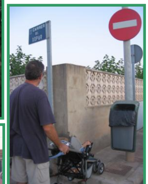
Avenida Mediterránea ¿aparcamientos? ¿aceras? ¿dos direcciones?