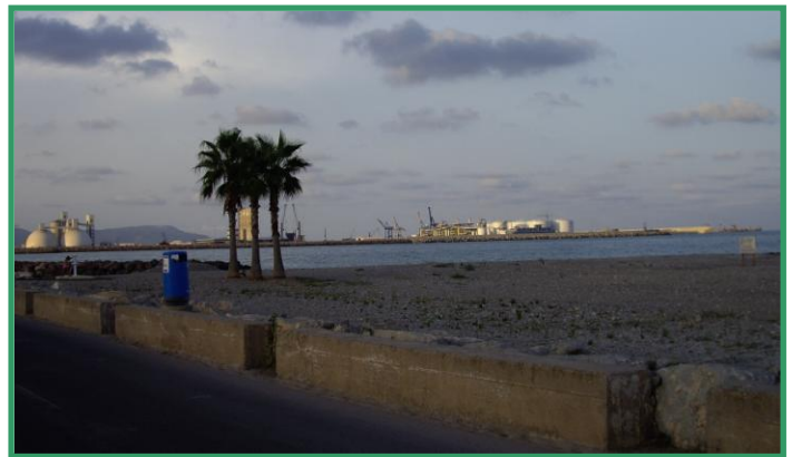
Impacto medioambiental sobre la playa de Almassora del polígono del Serrallo y del puerto de Castellón

En julio de este año 2009, la mayoría de propietarios afectados por el proyecto decidimos crear esta Plataforma con el fin de defender una playa más digna para todos. No es que no queramos un paseo marítimo, sino que nos oponemos a esta propuesta. Con este boletín pretendemos mostrar nuestra visión del proyecto y facilitar la información que se ha intentado ocultar.