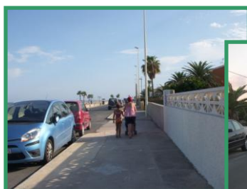
Plà de la Torre

El proyecto de construcción de un paseo marítimo no tiene sentido cuando ya existe uno. En todo caso sería un proyecto de remodelación, mejora, etc... Lo que habría que solucionar es el problema del tráfico, competencia del Ayuntamiento. De hecho ya existen zonas en el actual paseo marítimo donde conviven aparcamientos, vehículos y peatones, y paradójicamente son las zonas más afectadas por la posible construcción de un nuevo paseo.