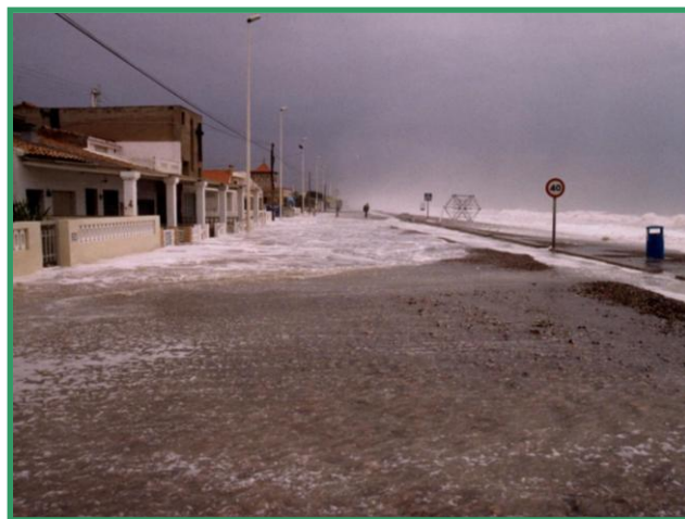
Temporal al Plà de La Torre

El actual borrador de paseo permitirá que Almassora tenga más playa. Pero cuidado, que nadie se lleve a engaño, no se recupera la playa al mar para reconstruir ese pedazo de costa que el Puerto de Castellón nos arrancó, lo que se pretende hacer es destruir o suprimir el actual paseo marítimo y llenarlo de arena , es decir, acercar más la playa al núcleo urbano y eliminar parte del muro de protección existente llenándolo de dunas de arena.